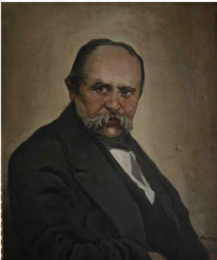
Рисунок 1. Труш І. Портрет Т. Шевченка. Д., о. 73,7 × 60,6. ЛНЛММ Івана Франка. Інв. № Хут-8