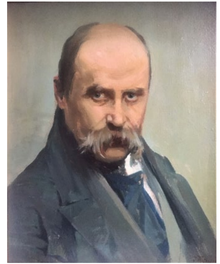
Рисунок 3. Труш І. Портрет Т. Шевченка. Д., о. 45 × 39. Приватна збірка

За основу для свого твору І. Труш обрав відносно маловідому світлину Т. Шевченка і його приятеля, художника Г. Честахівського, виконану відомим фотографом Миколою Доссом у 1860 році. Художник міг колекціонувати світлини поета. Пишучи листи своїй дружині, він користувався поштівками з образом Кобзаря, про що свідчить, наприклад, його вісточка за 1910 р. [6]. Виконуючи живописний образ, І. Труш композиційно обрізає фотографію, залишаючи із двох сидячих півфігурних постатей лише погрудний портрет поета. На картині, як і на світлині, Шевченко зображений упівоберта до глядача, голова трохи нахилена. Його кругле обличчя має ледь помітні ознаки хворобливої набрякlosti. На цю особливість у вересні 1859 року, тобто за рік до часу позування в ательє Досса, звертає увагу Л. Тарновська в листі до свого сина: «Бедный Шевченко болен, и я боюсь, не водянка ли у него в груди; он не лежит, но движение его тяжело и лицо обрюзгло [7].