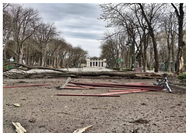
Рис.2 Приклади руйнації ландшафтних об'єктів центру м. Харкова [5,6].

Таким, чином, для ефективного вирішення проблемної ситуації, що виникла, потрібна розробка науково обґрунтованого підходу відновлення ландшафтних об'єктів історичного центру. Він має базуватися на пріоритеті екологічних та історико-культурних цінностей. З цих позицій відкриті простори