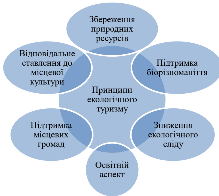
Рисунок - 1 Принципи екологічного туризму